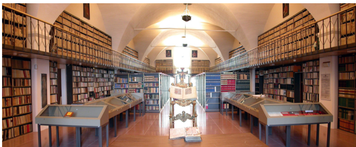
Assisi, Biblioteca del Sacro Convento