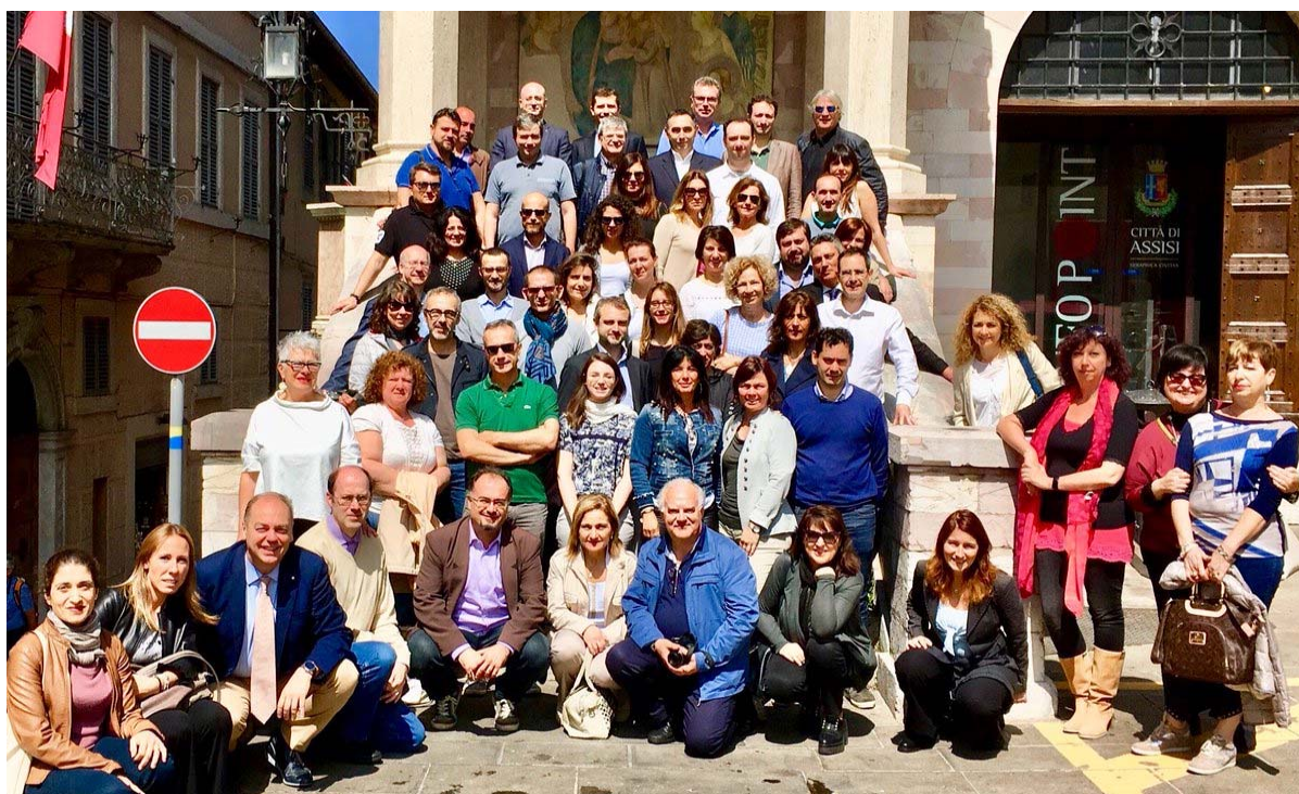
Assisi, 25 maggio 2018