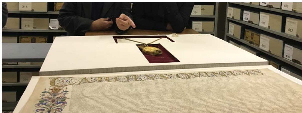
Diploma imperiale di Carlo V di investitura ducale a Francesco II Sforza (1530)