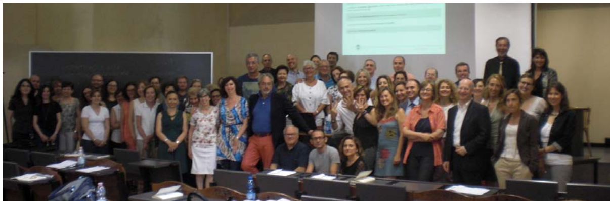
Pavia, 30 giugno 2015

L'acronimo sta per Proced (imenti) am (ministrativi) delle u (niversità) degli s (tudi), ma l'attività formativa e di intervento è fortemente consigliata a tutte le amministrazioni pubbliche, in modo particolare per la metodologia di mappatura dei procedimenti e per l'introduzione del digitale nativo, in quanto problematiche condivise nel digital first .