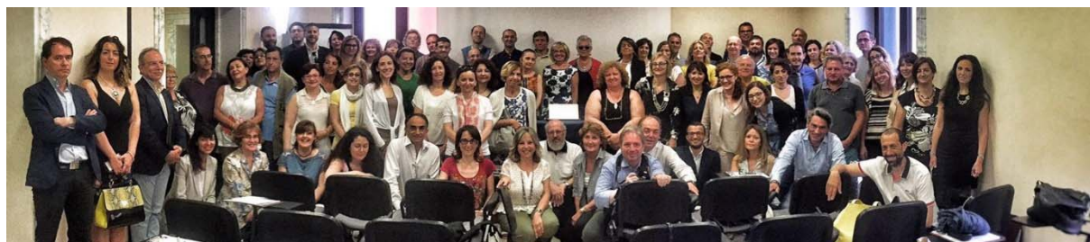
Roma, giugno 2016

Con il programma 2017 continueranno le consolidate e apprezzate lezioni frontali , le quali saranno affiancate, come ormai da tradizione, dalla "Formazione-intervento - Gruppi di lavoro" su tematiche di interesse comune e trasversale.